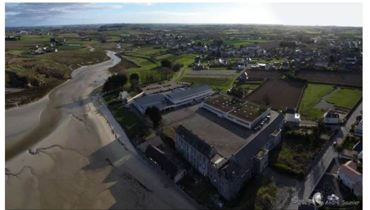
Skolaj Gwiseni-Collège Guisseny 29